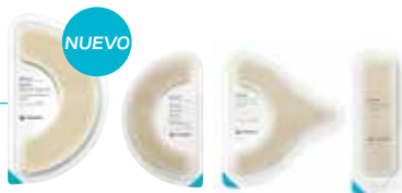
Tira de barrera elástica extra grande (XL) Brava®

La Tira de barrera elástica extra grande (XL) Brava ofrece un área de adhesivo aún más grande para una mayor sensación de seguridad.