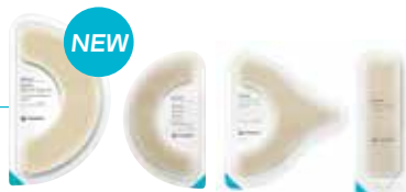
Brava® Elastic Barrier Strip XL

Brava Elastic Barrier Strip XL provides an even larger adhesive area for a greater sense of security.